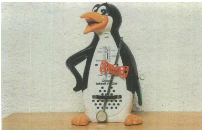
Mélo die joue accompagnée de ce métronome en forme de pingouin.

Album à commander sur internet: www.cdbaby.com