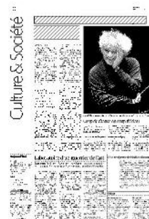
Simon Rattle. Un charisme naturel, entre gloire et humanité. Avec un sens de l'honneur très british.